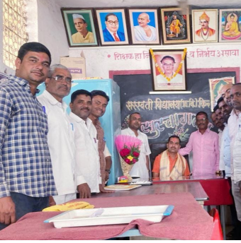
दिली असून शाळेच्या प्रगतीसाठी सर्वाना सोबत घेऊन चांगले कार्य करणारा असून विद्यालयाच्या भरभराटीसाठी परिश्रम घेणार आहे