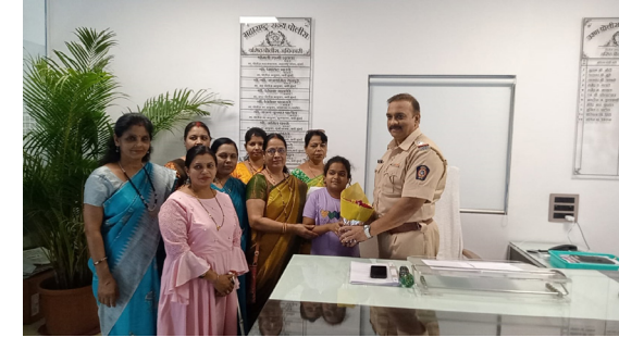
दैनिक वादळ वार्ता उरण/विठ्ठल ममताबादे

बसंत पंचमी उत्सव मंडळ ट्रस्ट तर्फे महिलांच्या समस्या सुट्याच्यात यासाठी पोलीस प्रशासन व तहसील प्रशासनाला देण्यात आले निवेदन. निवेदनाद्वारे समस्या सोडविण्याची केली मागणी.