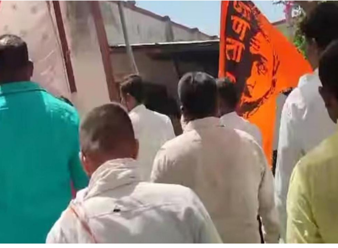
वादळवार्ता/बीड बीड - मराठा समाजाला

ओबीसीमधून आरक्षण देण्याच्या मंजूर्याच्या जरागे यांच्याकडून राज्यभराचा दौरा केला असून, दुसरीकडे याच मागणीसाठी मराठा आंदोलक आक्रमक होतांना पाहायला मिळत आहे. दरम्यान, गावात येणाऱ्या राजकीय नेत्यांना मराठा आंदोलक जाब विचारतांना दिसत आहे बीड जिल्ह्यात मराठा आंदोलकांनी भाजपचे माजी आमदार