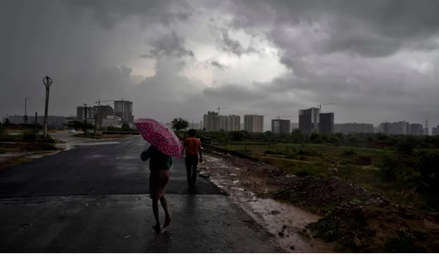
वादळवार्ता/ मुंबई भागांत तूट निर्माण केली. सरासरीपेक्षाही मागील वर्षे मान्सूनने देशातील अनेक कमी पाऊस बरसला. परंतु यंदा