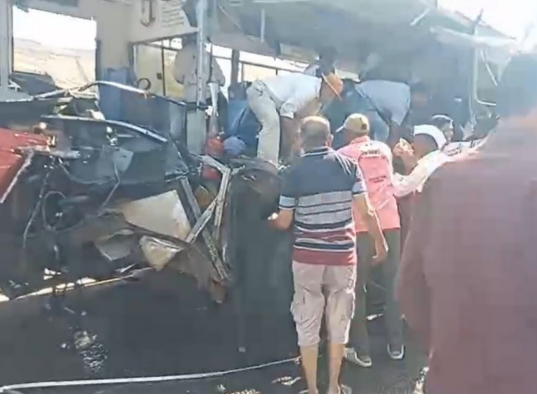
झाला असून अपघाताची माहिती मिळताच

मुंबई आग्रा महामार्गावरील राहुड घाटात एसटी बसचा भिशन अपघात झाला आहे. एसटीचे टायर फुटल्याने ती ट्रकला जाऊन धडकल्याने हा अपघात झाला असून त्यात सहा जणांचा जागीच मृत्यू झालेला आहे, अशी प्राथमिक माहिती मिळत आहे. अपघाताची तीव्रता पाहता मृतांची संख्या वाढण्याची शक्यता आहे. चांदवड जवळ राहुड घाटात हा अपघात