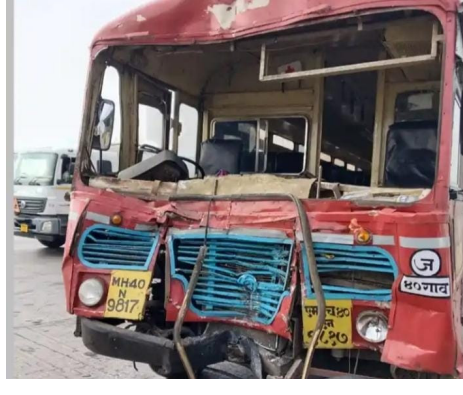
शहरातील खाजगी रुग्णालयात दाखल

चाळीसगाव आगाराची बस जळगाव कडून मुंबईच्या दिशेने जात असताना पिंपळगाव बसवंत शहरातील टोल नाका परिसरात बस ने एका रसायन घेऊन जात असलेल्या टॅक्सीला मागून जोरदार धडक दिल्याने हा अपघात झाला . वाहकाचे बस वरील नियंत्रण सुटल्याने ही धडक बसल्याची प्राथमिक माहिती असून या धडकेमध्ये बसमधील चालक ,वाहकासह जवळजवळ 27 प्रवासी जखमी झाले. त्यांना पिंपळगाव