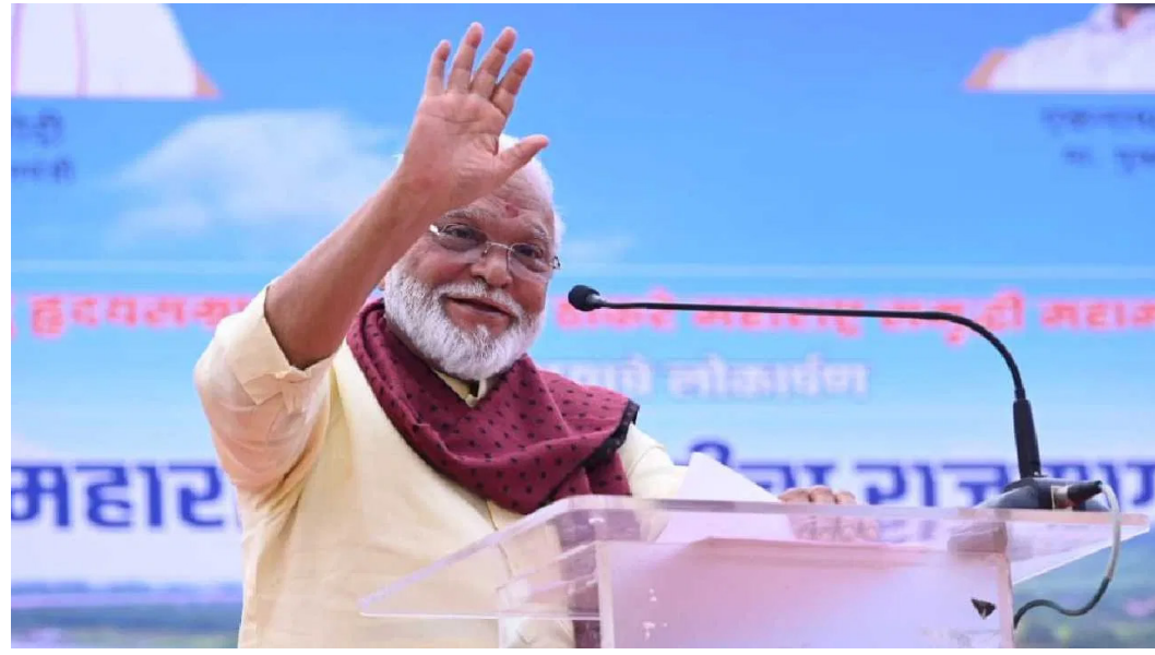
तशी नाही. महायुतीच्या जागा मोठ्या प्रमाणात निवडून येणार आहे. नरेंद्र मोदी पुन्हा पंतप्रधान होणार आहेत, असा विश्वास छगन भुजबळ यांनी

गरीब आहेत. अचानक निर्यातबंदी होते तेव्हा कांदा फेकून द्यावा लागतो. त्याला काही भरपाई मिळत नाही. मागच्या काही वर्षात मी मागणी केली त्यावेळी कांदा अनुदान मिळाले होते. शेतकरी, व्यापारी व काही तज्ञ बसवा आणि निर्यातबंदी वर कायमस्वरूपी मार्ग काढा. कांदा निर्यातबंदी कायमची उठवा. साखर, द्राक्षे निर्यातबंदी आता हळूहळू उठवत आहे. या गोष्टी व्हायला नको, यावर मी पंतप्रधान मोदी यांना बोललो. अबकी बार मोदी सरकार, मुझे बिलकुल शक नाही, असं छगन भुजबळ म्हणाले. निवडणुकीवर काय म्हणाले? उद्या ते 48 जागा जिंकू असे म्हणतील त्यावर विश्वास ठेवणार का? लोकांना ओढण्यासाठी या गोष्टी बोलायच्या असतात. ग्रांड रियालिटी