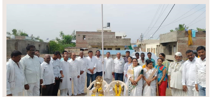
महाकारणीय तथागत गौतम बुद्ध यांची जयंती महात्मा फुले नगर केज येथे मोठ्या हर्ष उल्हासाच्या वातावरणामध्ये साजरी करण्यात आली प्रसंगी फुलेनगर येथील सर्व बौद्ध उपासक उपासिका.