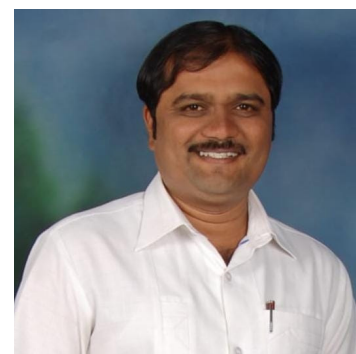
कलाकार कट्ट्याचे संस्थापक