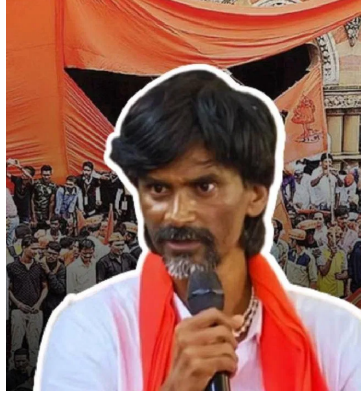
आमचे पण कुणीतरी असतीलच ना. महाराष्ट्रात रस्त्यावर उतरून दंगल घडवून आणण्याला छगन

ब्रिटीश कालीन जनगणनेत मराठा कुणबी दाखवलाय. 1871 मध्ये पुरावे आहेत. ते ही घेत नाहीत” असं मनोज जरांगे पाटील म्हणाले. “छगन भुजबळला स्वतःची लेकर कळतात, तशी मग दुसऱ्याची लेकर कळायला पाहिजे. धनगर-मराठ्यांमध्ये भांडण लावतायत हे छगन भुजबळने कमी केलं पाहिजे” असं मनोज जरांगे पाटील म्हणाले. “छगन भुजबळ 100 टक्के दंगल घडवणार. धनगरांनी वाद चिघळू देऊ नये. शेवटी निर्णय तुमचा आहे. त्यांचे वाघ आहेत,