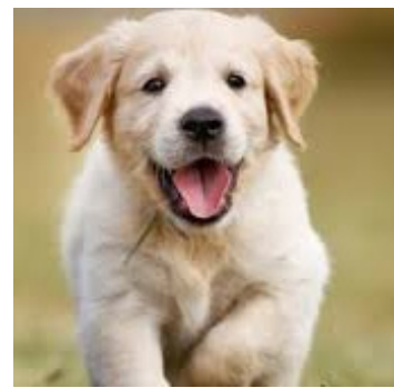
लसीकरण दरम्यान मृत्यू नसून त्याला तोंडावर , अंगावर असे मारहाण करून