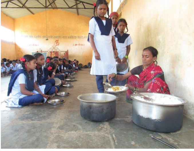
तांदळाची खीर, चणा पुलाव, नाचणीचे

अंबाजोगई/परवेज पटेल प्रधानमंत्री पोषणशक्ती निर्माण योजनेतर्गत शैक्षणिक वर्ष २०२४-२५ पासून पोषण आहारामध्ये विद्यार्थ्यांना दिल्या जाणाऱ्या १५ पाककृती निश्चित करण्यात आल्या असून ३ संरचित आहार पद्धती नुसार व्हेजिटेबल पुलाव, नाचणी सत्त, अंडा पुलाव, तांदळाची खिचडी अशा पदार्थांचा समावेश करण्यात आला आहे. त्यामुळे विद्यार्थ्यांची खिचडीपासून सुटका होणार असून निश्चित केलेल्या पाककृती मध्ये व्हेजिटेबल पुलाव, अंडा पुलाव, मसाले भात, मोड आलेली मटकीची उसळ, मटार पुलाव, गोड खिचडी, मुगडाळ, खिचडी, चवळी खिचडी, मुग, शेवगा, वरण भात,