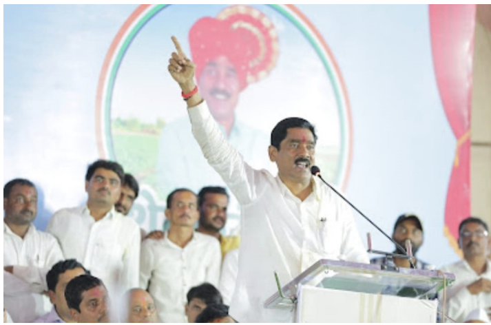
म्हणून मी देशाच्या संसदेत वंदन करतो. तुम्ही दिलेली शक्ती पोहोचलो. विनम्रपणे तुमचा हा सत्कार स्वीकारतो. आपणा सर्वांना आता देशाच्या संसदेत गर्जत आहे. तुमचा आवाज तिथपर्यंत

वादळवार्ताचे निमित्त, लोकसभेचा विजय आणि माझ्या हृदयातल्या माणसांनी केज शहरात आयोजित नागरी सत्कार सोहळ्यात माझा अविस्मरणीय सन्मान केला. त्यापूर्वी झालेले भव्य स्वागत कधीही विसरू शकणार नाही. हा पारिवारिक सोहळा होता. माणसे मोठ्या उत्साहात आपापली कामे टाकून माझ्यासाठी, माझ्या प्रेमापोटी आली. त्यांचा सत्कार स्वीकारून आभार मानत सर्वांशी संवाद साधला. “तुमच्यातला आपला माणूस