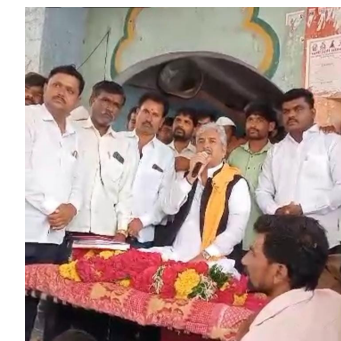
भगवानगडाचा भक्तवर्ग गडावरील

ग्रामस्थांनी गडावरील माऊलीच्या मंदिरासाठी देणगी द्यायचे ठरविले. त्यानुसार ग्रामस्थांनी आपापल्या देणगीचे आकडे जाहीर केले. जाहीर केलेल्या आकडेवारीनुसार संपूर्ण आकडेवारीची गोळाबेरीज ही ५१ लाख रुपये झाली. नोकरी/व्यवसायानिमित्ताने बाहेरगावी असणाऱ्या ग्रामस्थांच्या देणगीचे आकडे आणखी बाकी आहेत. एकंदरीत श्री क्षेत्र