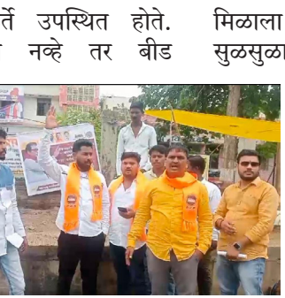
कार्यकर्ते उपस्थित होते. एवढेच नव्हे तर बीड सुळसुळाट अजूनही चालूच आहेत मात्र चोरांचा अजूनही चालूच असायला येत आहे. नागरिक मात्र भयभीत आहेत पोलीस प्रशासन चोरी टाकण्यात अपयशी ठरत आहे मात्र काही चोर पकडले आहेत मात्र यामागे नक्की कोण आहे याचा तपास अजून लागलेला नाही त्यामुळे बीड शहरात अजूनही दहशतीचे वातावरण पाहायला मिळत आहे.