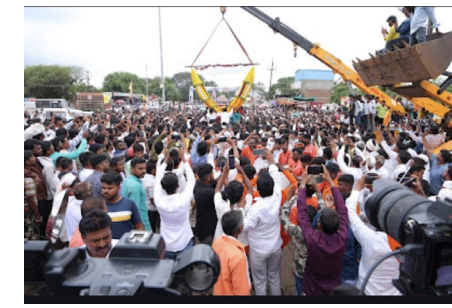
राहणार नाही. माझ्या जिल्ह्याचा विकास माझ्यासाठी सर्वोपरी आहे. त्याबाबतीत कुठलीही तडजोड

आणि तुमच्याच प्रेमांमुळे घडले. सर्व समाजाच्या मतांवर मी निवडून आलो. तुमचे हे पांग फेडल्याशिवाय