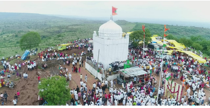
देवस्थान म्हणून भाविक या ठिकाणी भ्रमण करणाऱ्या सोपी संतां पैकीच नवस करतात पूर्वी एकेश्वर वादाचा प्रचार आणि प्रसार करत भारतभर

आष्टी तालुक्यातील हिवरा डोंगरगण, दादेगाव, भोजेवाडी या गावचे श्रद्धास्थान आणि ग्रामदैवत रोडागिरी बाबांच्या यात्रा उत्सव गुरुवार दिनांक २५ जुलै रोजी उत्साहात संपन्न होत आहे निसर्गमय परिसरात असलेले सर्व धर्मीयांचे श्रद्धास्थान व जागृत देवस्थान असलेल्या रोडागिरी बाबांच्या दर्गावर दर्शनासाठी मुंबई पुणे अहमदनगर तसेच तालुक्यातून मोठ्या संख्येने भावी हजेरी लावतात गावभरातून भाविकांसाठी दिवसभर प्रसाद वाटप करण्यात येतो जागृत