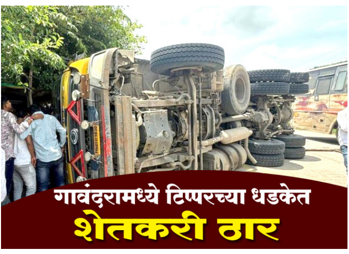
गावंदरामध्ये टिप्परच्या धडकेत शेतकरी ठार

खेळी करण्याच्या तयारीत आहेत. प्रकाश आंबेडकर राज्यातील जनतेच्या समोर पर्याय म्हणून तिसरी आघाडी स्थापन करणार आहेत. या तिसऱ्या आघाडीसाठीच प्रकाश आंबेडकर यांनी दोन मोठ्या नेत्यांना खुली ऑफर दिली आहे. यामध्ये पहिलं नाव हे राष्ट्रवादी काँग्रेसचे ज्येष्ठ नेते छगन भुजबळ यांचं आहे. तर त्यांची दुसरी ऑफर माकप नेते तथा माजी आमदार जे