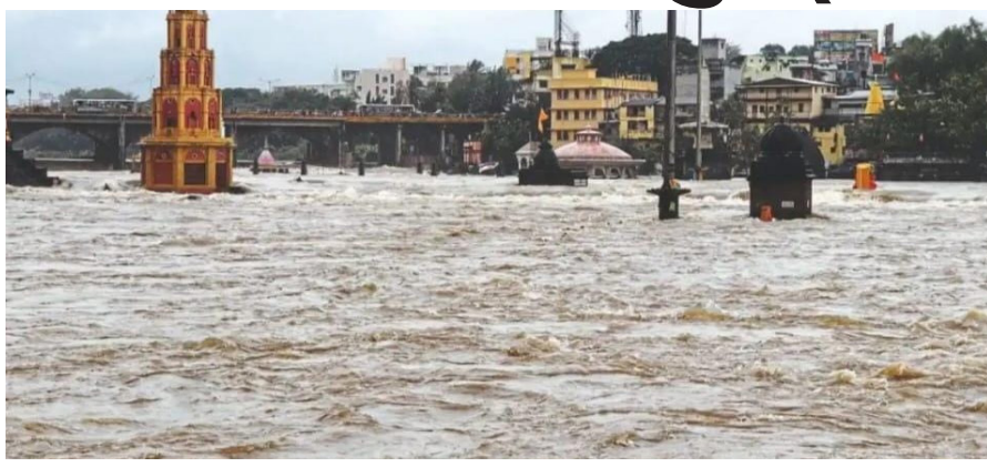
दशक्रिया विधीसाठी आलेल्यांना मिळेल त्या ठिकाणी दशक्रिया विधी करावे लागत आहे. पाणी वाढण्याची शक्यता गृहीत धरत अनेकांनी पंचवटीतील दुर्तांड्या मारुतीच्या

दिवस पावसाचा अंदाज कायम असल्याची संकेत असल्यामुळे पुराची पातळी वाढण्याची शक्यता आहे. गोदावरी नदीला पूर आल्यामुळे रामतीर्थ परिसरातील मंदिरे आणि परिसर हा पाण्याखाली गेलेला असून दशक्रिया करण्याच्या मोठी गैरसोय होत आहे. त्यामुळे अनेकांनी मिळेल त्या ठिकाणी दशक्रियाची विधी उरकावी लागत आहे. दरम्यान पाऊस सुरूच असल्याने विसर्ज वाढण्याच्या शक्यतेने नदीकाठच्या व्यावसायिकांमध्ये भीतीचे वातावरण आहे. गोदाकाठवर शहरासह जिल्हा राज्य ते देशभरातून भाविक नाशिकला येत असतात, परंतु सध्या रामतीर्थ पाण्याखाली गेल्यामुळे शहर व पंचवटी परिसरातील