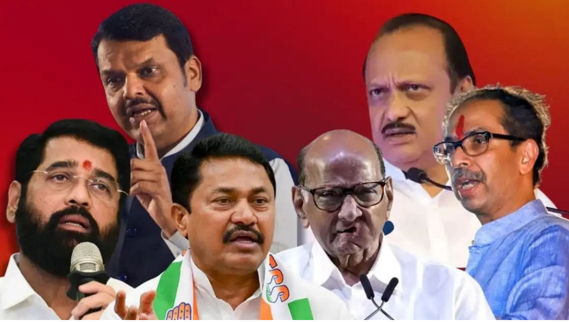
पवारांच्या पक्षाला ५५ ते ६० जागा तर उद्धव ठाकरे यांच्या पक्षाला आघाडीची सत्ता येण्याचा

आगामी विधानसभा निवडणुकीच्या पार्श्वभूमीवर काँग्रेसने देखील अंतर्गत सर्व्हे केला आहे. या सर्व्हेनुसार मविआमधील कोणता पक्ष किती जागा मिळणार याबाबतचा अंदाज समोर आला आहे. काँग्रेसच्या या प्राथमिक सर्व्हेनुसार राज्यामध्ये महाविकास आघाडीची सत्ता येणार असल्याचा अंदाज वर्तवला जात आहे. या सर्व्हेनुसार सर्वाधिक जागा ८०-८५ जागा काँग्रेसला मिळण्याचा अंदाज आहे. काँग्रेसच्या अंतर्गत सर्व्हेबाबत समोर आलेल्या माहितीनुसार काँग्रेसला ८० ते ८५ जागा मिळण्याचा अंदाज आहे. शरद