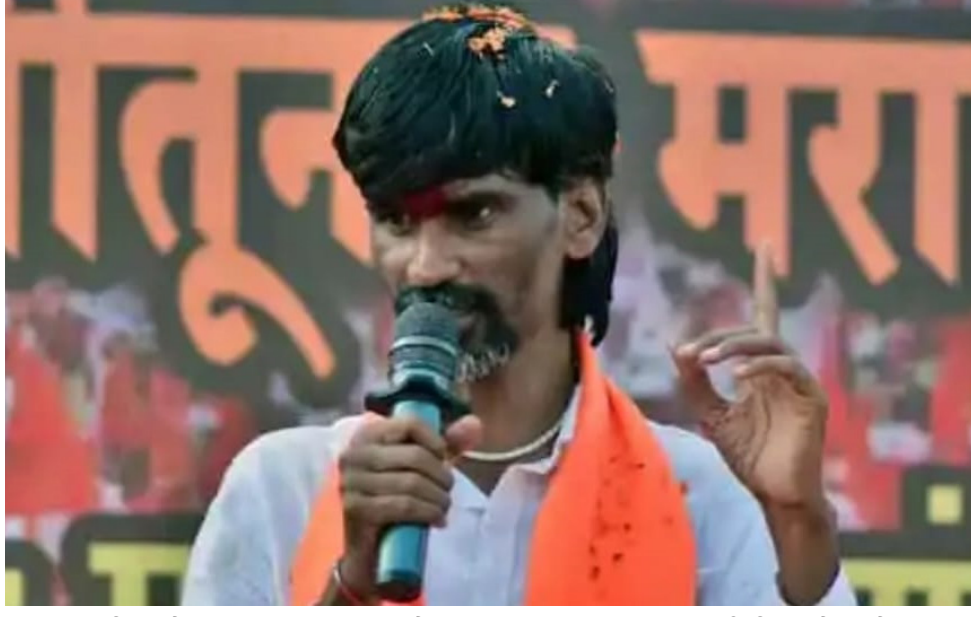
आरक्षण मिळावे असा हद्द जरांगे मुद्दाला नाहक खतपाणी मिळाले आहे. पाटील यांनी धरल्याने आरक्षणाच्या ओबीसी समाजाला महा कष्टाने आरक्षण

निवेदनामध्ये म्हटले आहे की ओबीसीच्या आरक्षणाला धक्का न लावता मराठा समाजाला आरक्षण मिळावे अशी सुरुवातीला मराठा आंदोलकाची मागणी होती, मात्र ओबीसीतूनच आम्हाला