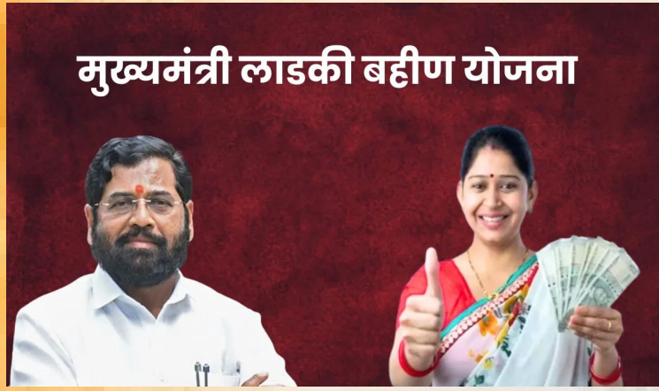
मुख्यमंत्री लाडकी बहीण योजना

एक भाग म्हणून महिलांच्या बँक खात्यात जुलै आणि ऑगस्ट या दोन महिन्यांचे पैसे जमा केले जात आहेत, अशी माहिती