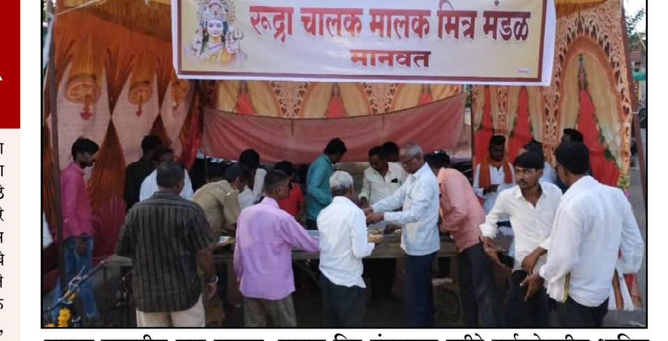
मानवत शहरातील रूद्रा चालक, मालक मित्र मंडळाच्या वतीने दूर्गात्सोवातील भाविक भक्तांना मिरवणूकी दरम्यान एक किड्डल स्वादिष्ट खिचडीचे वाटप करण्यात आले. या वेळी मंडळाचे पदाधिकारी व कार्यकर्ते यांचासह चालक मालक उपस्थित होते.