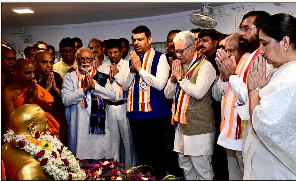
समाजातील सर्व घटकांना सोबत घेऊन देशाचा सर्वांगीण व वेगवान विकास साधणे हेच त्यांना खरे अभिवादन असल्याचे त्यांनी सांगितले. चैत्यभूमी ही बाबासाहेबांच्या विचारांचे ऊर्जा केंद्र असल्याचे उपमुख्यमंत्री सुनेत्रा अजित पवार यांनी सांगितले. डॉ. बाबासाहेब आंबेडकर हे कायदेतज्ज्ञ, घटनातज्ज्ञ आणि अर्थतज्ज्ञ होते. एकता, समता आणि बंधुता या मूल्यांमध्ये समाजाला बांधून त्यांनी प्रत्येकाला सन्मानाने व स्वाभिमानाने जगण्याचा मार्ग दाखवला. त्यांच्या विचारांची मशाल सतत तेवत ठेवून त्यानुसार आचरण करणे गरजेचे आहे. इंदू मिलच्या जागेवर उभारण्यात येत असलेले डॉ. बाबासाहेब आंबेडकर यांचे आंतरराष्ट्रीय दर्जाचे स्मारक जगाला शांतता आणि समतेचा संदेश देणारे केंद्र ठरेल, असा विश्वासही उपमुख्यमंत्री सुनेत्रा अजित पवार यांनी व्यक्त केला. सर्वप्रथम भारतीय राज्यघटनेचे शिल्पकार भारतरत्न डॉ. बाबासाहेब आंबेडकर यांच्या महापरिनिर्वाण दिनानिमित्त राज्यपाल जिष्णु देव वर्मा, मुख्यमंत्री

प्रबंधात मांडलेल्या तत्वांवरच भारताची अर्थव्यवस्था उभी आहे, असेही मुख्यमंत्री देवेंद्र फडणवीस यांनी स्पष्ट केले. भारतरत्न डॉ. बाबासाहेब आंबेडकर यांनी दिलेले संविधान हाच आपला राष्ट्रधर्म असून बाबासाहेब हे केवळ भारतीय संविधानाचे शिल्पकार नसून माणुसकीचेही शिल्पकार आहेत. त्यांनी लिहिलेल्या राज्यघटनेमुळे देशातील शेवटच्या माणसालाही न्याय आणि सन्मान मिळण्याचा मार्ग सुकर झाला, असे उपमुख्यमंत्री एकनाथ शिंदे यांनी सांगितले. महापुरुष शांततेतून जेव्हा कृती करतात, तेव्हा ती क्रांती ठरते. महाड चवदार तळे सत्याग्रहातून समाजात आत्मसन्मानाची जाणीव निर्माण झाली. बाबासाहेबांनी आयुष्यभर शोषित, दलित आणि वंचित घटकांसाठी काम करून त्यांना सक्षम केले. डॉ. बाबासाहेब आंबेडकर यांनी दिलेल्या संविधानामुळे भारताची लोकशाही जगात भ्रमणपणे उभी आहे. इंदू मिल येथे उभारण्यात येत असलेल्या आंतरराष्ट्रीय दर्जाच्या स्मारकाचे काम वेगाने सुरू असून हे स्मारक पुढील पिढ्यांसाठी प्रेरणास्थान ठरेल, असा विश्वास त्यांनी व्यक्त केला. भारतरत्न साजरी होणारी डॉ. बाबासाहेब आंबेडकर यांची जयंती ही स्वाभिमान आणि विवेकाचा उत्सव असून त्यांचे विचार जपणे आणि ते आचरणात आणणे हीच त्यांना खरी आदरांजली ठरेल. भारतरत्न डॉ. बाबासाहेब आंबेडकर यांची जयंती ही प्रेरणा, संकल्प आणि कृतज्ञता व्यक्त करण्याचा तसेच त्यांच्या विचारांचे स्मरण करण्याचा दिवस आहे. डॉ. आंबेडकर यांच्या मानवकल्याणाच्या विचारांना पुढे नेणे आणि